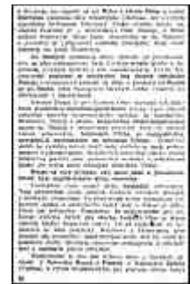
Seite 30 des tschechischen Originals. Anlicken, um zu vergrößern!

Die Erfahrungen des Weltkrieges haben gelehrt, daß der eigentliche Böhmerwaldrücken nicht mehr als Schutz des böhmischen Kessels angesehen werden kann. Es ist unerlässlich, in den Verteidigungsgürtel Böhmens gegen einen deutschen Überfall den ganzen westlichen Fuß des Böhmerwaldes einzubeziehen, gegen Süden bis zur Donau zwischen Passau und Regensburg, im Westen bis zur Naab und Haide, - Naab mit dem ganzen Fichtelgebirge (Westgrenze des einstigen Egerlandes, aber mit dem ganzen westlichen Kamme des Fichtelgebirges). Die tschechischen Vorhuten an dem heute bayrischen Teile der Donau und an der Naab werden den Streitkräften der Festlandszone Zeit gewinnen, damit sie sich am Böhmerwald entwickeln und eventuell durch die dortigen Pässe vorbrechen und das Vaterland auf deutschem Boden wirksamer verteidigen können.