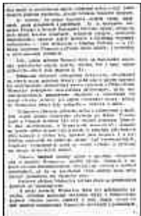
Seite 15 des tschechischen Originals. Anlicken, um zu vergrößern!

Es ist klar, daß dem Störenfried sehr beträchtliche Einbußen an Gebiet und Seelenzahl nicht erspart bleiben dürfen, daß es unerlässlich ist, Preußen und das ehemalige Österreich-Ungarn vollständig zu sprengen und an ihre Stelle einen Kordon verhältnismäßig starker, widerstandsfähiger "Rührmichnichtans" als Wachposten zu ziehen, ihre Grenzen aber unter dem Gesichtspunkte militärischer Zweckmäßigkeit zu regeln - gegenüber den Deutschen und auch den Blöcken des Verbandes - und dem restlichen Deutschland genau die Siedlungsgrenzen anzuweisen und innerhalb derselben eine freie nationale Entwicklung.