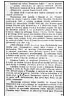
Seite 29 des tschechischen Originals. Anlicken, um zu vergrößern!

Das Elbetor in Nordböhmen und die Pässe über das Erzgebirge nach Sachsen müssen durch Annexion des einstigen Hvoždansko und Niederlandes in den auf der Karte 5 bezeichneten Grenzen gesichert