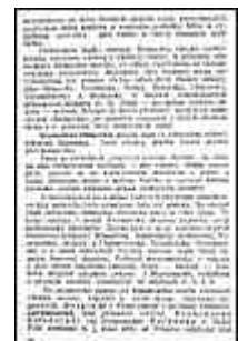
Seite 16 des tschechischen Originals. Anklicken, um zu vergrößern!

Eine weitere Bedingung: Deutschland ist alle überflüssige Kriegsausrüstung und Bewaffnung überhaupt abzunehmen, und es ist zu verhindern, daß das künftige Deutschland Heeres-Industrie-Betriebe errichte oder überhaupt erhalte. Es ist wünschenswert, daß die Karte in Hinkunft nur das Gebiet der folgenden Gliedstaaten des ehemaligen Deutschland ausweise: Westfalen, Sachsen, Bayern, Hessen, Württemberg und Baden, in jenen Grenzen, die in der beigeschlossenen Karte (Nr. 3) ersichtlich gemacht sind. Im übrigen wird - nach der Meinung von uns Tschechen - weder Europa noch die Welt etwas dagegen haben können, wenn sich dieser Rest von "Deutschland" nach Art der übrigen großen Rassen in einen einheitlichen Verband deutscher Staaten zusammenschließt.