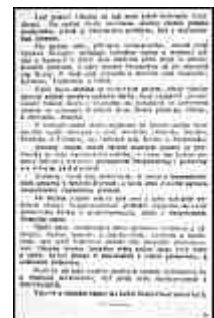
Seite 5 des tschechischen Originals. Anklicken, um zu vergrößern!

Das Lebensinteresse aller dieser Teile der Zone ist das gleiche. Sie alle verbindet die territoriale