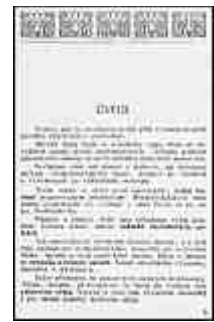
Seite 3 des tschechischen Originals. Anlicken, um zu vergrößern!

Während des Krieges hat sich als solcher Machtfaktor bloß der Staatenblock englischer Zunge erwiesen, der ozeanische, meerbeherrschende . Zum erstenmal ist auch, obwohl noch zutage nicht