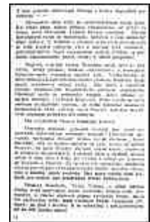
Seite 12 des tschechischen Originals. Anlicken, um zu vergrößern!

Das Slawentum neigte immer zur freiheitlichen Staatsform. Zur Herrschaft der Gemeinde , nicht zur Herrschaft eines einzelnen Machthabers, obwohl gerade diese Staatsform den Slawen besonders verhängnisvoll geworden ist. Den slawischen Gemeinden ging es häufig schlecht, wenn nicht an ihrer Spitze eine starke staatsmännische Persönlichkeit stand. In keinem Volke der Welt fanden sich so viele Verräter der gemeinsamen Sache aus rein persönlichen Gründen, aus Gründen der Bequemlichkeit. Es genügt, an unsere "Otiken" und an das verderbliche polnische Vetorecht in der Republik zu erinnern.