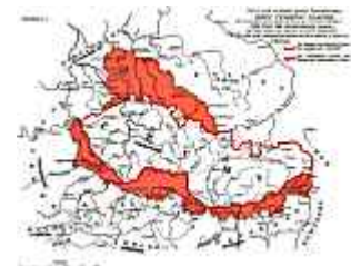
Aus Nachdruck der deutschen Übersetzung vom Jahre 1922

Auch die Spuren der einstigen sprachlichen Einheit - soweit sie sich in den örtlichen Bezeichnungen erhalten haben - sind ein Beleg für den einstigen politischen Europabund. Nichts Neues unter der