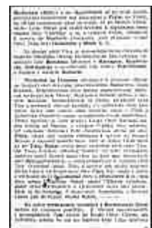
Seite 31 des tschechischen Originals. Anlicken, um zu vergrößern!

Die dortige Donaulinie muß man sich gründlich sichern. Man muß dort vor allem starke tschechische Dauergarnisonen mit ausgedehnten Brückenköpfen unterhalten. Vor allem muß man sich die Wankelmütigkeit des Menschengeschlechts vergegenwärtigen und in Sicherheit bringen, wenn und solange sich diese einzige Gelegenheit bietet, eingedenk dessen, daß wir nicht für die heutige Generation arbeiten, sondern für alle Zukunft. Für sie gilt es, eine ruhige und gesicherte Entwicklung zu gewährleisten. Es ist hier nur zu beklagen, daß uns nicht zustatten kommt, was sich dereinst für Moses und sein Hebräertum so vorteilhaft erwies: warten zu können, bis ein schwächliches, durch lange Sklaverei an Unterwürfigkeit und persönliche Rücksichtnahme gewöhntes Geschlecht ausgestorben war.