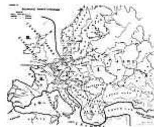
Tschechisches Original a.d.J. 1918

Eine solche "Mißgeburt", wie sie durch die bereits erwähnte Karte veranschaulicht wird, wäre aber nicht einmal ein tauglicher "Pufferstaat".