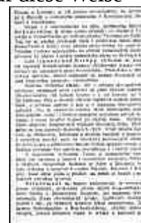
Seite 17 des tschechischen Originals. Anklicken, um zu vergrößern!

Die Mittelmark (Středomezí), auf der Karte veranschaulicht, ist ein eventuelles Neugebilde, nämlich die neutrale Zone der wirtschaftlichen Beziehungen zwischen Tschechen und Südslawen. Ein Gebiet, das vollständig entdeutscht werden muß. Ein rein wirtschaftliches Bindeglied, das Tschechien namentlich auch das Salz sichern soll, das im tschechischen Vaterland nirgends