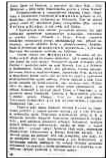
Seite 18 des tschechischen Originals. Anlicken, um zu vergrößern!

So beschaffen ist also die Karte des zukünftigen Mitteleuropa unter dem Gesichtspunkte des Bedarfes und der Interessen unserer Nation, aber auch ganz Europas und des Weltfriedens. Die beigezeichnete schematische Skizze Nr. 4 gibt ein Bild der neuen Gruppierungen. Durch ein System politischer Pufferstaaten, die unter der solidarischen Schutzgarantie der Entente rings um das Deutschtum gelagert werden, wird der Krieg - wenigstens für absehbare Zeit - überhaupt verhindert werden können. Nichtsdestoweniger aber auch das von dem militaristischen Deutschland geweckte und genährte Fieber unter den Völkern. Es ist die Pflicht unserer Vertreter, ausdrücklich von der Entente zu verlangen, daß sie solches zuwebringe; daß sie gewähre, was für unsere Zukunft und ihre Sicherheit unerläßlich ist. An der Geneigtheit der Entente werden wir untrüglich erkennen, wieviel Wahrheit und Aufrichtigkeit in dem Liedlein von der versprochenen "dauernden Freiheit und dem ewigen Frieden" steckt.