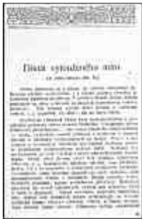
Seite 25 des tschechischen Originals. Anklicken, um zu vergrößern!

Man muß sich mit der Idee versöhnen, daß jedweder Separatismus die slawischen Nationen schädigt. Auch im Leben des einzelnen Menschen ist unangebrachte Eitelkeit schädlich. In der Politik konnte sie bestehen, solange Staaten und Völker als Besitz einzelner Personen, als Familienerbe angesehen wurden. So hat eigentlich das Zeitalter der "Herren" und des Umsturzes der "Gemeinden", d. i. der Republiken oder "Slavas" (politischer Gemeinschaften) - wie man sie vor alters nannte - begonnen.