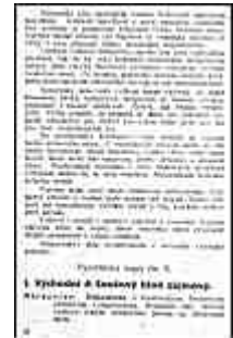
Seite 22 des tschechischen Originals. Anlicken, um zu vergrößern!

e) Sollte aber das ganze Deutschland oder ein Teil davon mit ausgesprochener Übermacht angreifen, so daß die ganze Föderation der Pufferstaaten nicht stark genug wäre, Widerstand zu leisten, so sind alle Mächte verpflichtet, sich solidarisch mit ihrer ganzen Macht zu erheben. Schon die bloße Drohung mit einem solchen Ansturm wird den Störenfried im Zaum halten. Der Pufferstaat wird so zu einem "Noli me tangere".