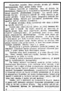
Seite 4 des tschechischen Originals. Anlicken, um zu vergrößern!