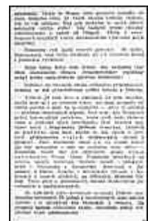
Seite 9 des tschechischen Originals. Anklicken, um zu vergrößern!