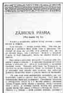
Seite 11 des tschechischen Originals. Anlicken, um zu vergrößern!

Der Charakter und die Hilfsmittel des Wohnsitzes bestimmen den Charakter und die Interessen der Völker und Rassen.