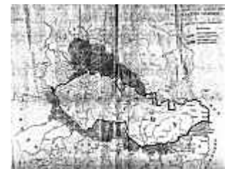
Tschechisches Original a.d.J. 1918