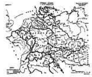
Tschechisches Original a.d.J. 1918

Serbien für die Mittelmark und Tschechien.