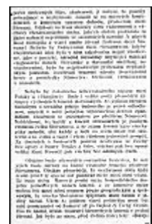
Seite 27 des tschechischen Originals. Anlicken, um zu vergrößern!

Hoffen wir, daß der Weltkrieg die Zahl der erleuchteten Köpfe vermehrt hat, und daß die durch den Krieg gewonnenen Erfahrungen unsere Stammesbrüder über die Unerläßlichkeit belehrt haben, sich auf den Friedenskonferenzen für eine endgültige rettende Einigung, vor allem unter den Slawen, einzusetzen. Die Ereignisse in Rußland haben den Wert der Gegenseitigkeit und der Erziehung in allslawischem Geiste gezeigt. Welche Dienste hat da der Kern unserer Landsleute dem größten slawischen Volke erwiesen! Und welche Schäden hat die von außen künstlich genährte Eifersucht unter den Slawen angestiftet! Es gäbe im Slawentum keinen Bolschewismus, wenn die allslawische Idee in ihm ebenso allgemein eingewurzelt wäre, wie in der tapferen, slawisch national gesinnten Jugend unserer "Legionäre". Die slawische und "Slava"-Gesinnung wäre, verallgemeinert, die wirksamste Schutzwehr gegen die Versuche der Feinde, die Brüdervölker durch die von den Deutschen bisher angewendeten Schlagworte und Praktiken in feindliche Lager zu spalten und gegeneinander zu hetzen, indem unter den Völkern die Eifersucht wachgerufen wird.