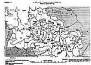
Tschechisches Original a.d.J. 1918

Einwendungen, die an den einstigen "rücksichtsvollen" Sklaven gemahnen, dürfen nicht die Überzeugung der ganzen Nation und der Entente werden.