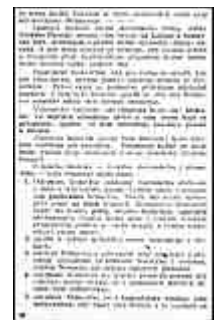
Seite 28 des tschechischen Originals. Anlicken, um zu vergrößern!

Das zukünftige Verwaltungsgebiet des slawischen Blocks, die "Gemeinde des tschechischen Volkes", wird bleiben, was es auch früher an der Elbe- und Böhmerwaldlinie gewesen ist: der Vortrab und Vorposten der östlichen "Slava" der Nationen . Man muß dieses Gebiet gehörig ausrüsten, damit hinter ihm ruhig und gesichert vor feindlichen Überfall die Frucht des Weltkrieges - der Weltfriede - ausreifen könne. Die von der Vorsicht diktierte Devise Roms, daß sich zum Kriege rüsten müsse, wer den Frieden haben wolle, ist durch die neuen Verhältnisse keineswegs hinfällig geworden. Gerade jetzt bietet sich die einzige Gelegenheit, gründlich wieder gutzumachen, worin gesündigt wurde, nämlich vorzukehren, daß uns die Deutschen nie wieder in unserer Existenz bedrohen können. Militärisch erläutert, besagt der römische Grundsatz: es ist alles zu beseitigen, was dem Feinde den Angriff erleichtert und uns eine erfolgreiche Verteidigung erschwert; alles jedoch vorzukehren, was uns die Niederwerfung und Bestrafung des Störenfriedes erleichtert.