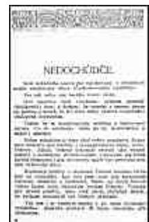
Seite 6 des tschechischen Originals. Anlicken, um zu vergrößern!

Verhältnisse und Umstände entscheiden. Der heutige Gesichtspunkt ist von dem gestrigen zu unterscheiden, da wir noch unter der Karbatsche deutscher und magyarischer Allmacht standen. Wir denken dabei hauptsächlich an die eingefleischte Furcht vor der "deutschen Stimmenzahl". Für die bestanden Verhältnisse typisch , heute aber ganz müßig ist die Furcht, wir könnten die annektierten "Deutschen nicht verdauen". Das gilt auch von der Entstehung der Karte des sogenannten "tschechoslowakischen" Staates: ein Pappzeug, aus drei Teilen des Volkes einfach zusammengeklebt.