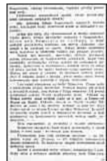
Seite 21 des tschechischen Originals. Anklicken, um zu vergrößern!

Unser nationales Interesse speziell legt unseren Vertretern auf der Weltkonferenz die Pflicht auf, diese Bedingungen unserer freiheitlichen Entwicklung bis in die letzten Folgerungen zu verfechten, nicht locker zu lassen und nicht nachzugeben, wo ein Nachlassen oder Abgehen vom Recht für die Zukunft schwere nationale Verluste verschulden könnte. Sie können das mutig tun in dem Bewußtsein, daß die Weltmächte sich des Gewinnes wohl bewußt sind, den sie aus einer Nation gezogen haben, deren bloß passives Verhalten die Macht der Zentralstaaten im Weltkriege gelähmt hat.