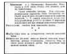
Seite 24 des tschechischen Originals. Anklicken, um zu vergrößern!

Deutschland wird, solange es der unverlässliche, weil treubruchtige Nachbar bleibt, von allen Welt-Zonen-Verbänden ausgeschlossen bleiben und unter der gemeinsamen Bewachung aller Nachbarn stehen.