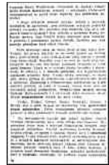
Seite 26 des tschechischen Originals. Anlicken, um zu vergrößern!

Sonne! Alles wiederholt sich in der Geschichte der Menschheit! Wo ein Verband und eine einheitliche Form der politischen Verwaltung besteht, dort ist auch der innere Verkehr der Bewohner untereinander freier und auch das Bedürfnis nach einer einheitlichen Sprache ist lebhafter. Es ist dabei nicht einmal notwendig, daß die Völker gleicher Abstammung sind.