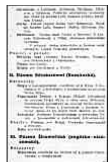
Seite 23 des tschechischen Originals. Anlicken, um zu vergrößern!

Die Pufferstaaten sind Rüstzeuge aus dem Arsenal der militärischen Politik.