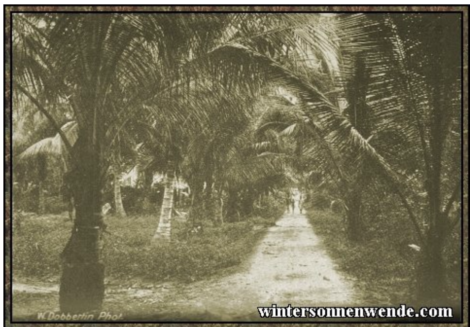
Kokosplantage in Deutsch-Ostafrika. [aus der engl. Ausgabe]

Es war der große deutsche Forscher Robert Koch selbst, der bei wiederholten Aufenthalten teils in deutschen, teils in englischen Kolonien epochemachende Entdeckungen gemacht und die Grundlage zur Bekämpfung von Seuchen gelegt hat. Welchen Segen dieser Mann und mit ihm und nach ihm andere Forscher und Ärzte den