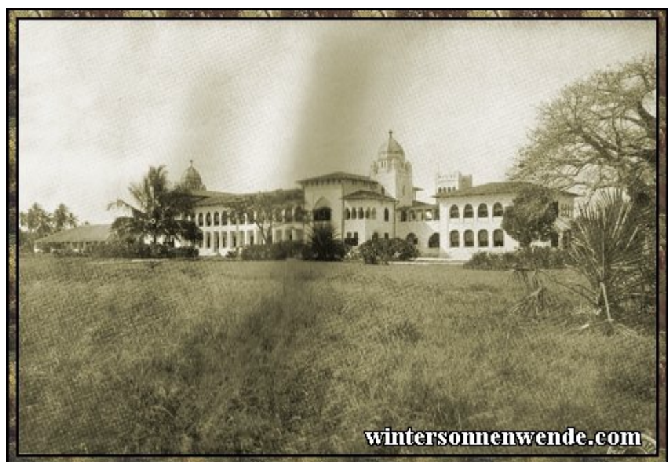
Gouvernements-Krankenhaus in Daressalam, Deutsch-Ostafrika.

Die gesundheitliche Fürsorge für die Eingeborenen beschränkte sich nicht auf die oben erwähnte Bekämpfung von Menschen- oder Tierseuchen. Es war auch für die Einzelbehandlung kranker Eingeborener in weitestem Maße gesorgt. Eine jährlich zunehmende Zahl von Ärzten, die vor ihrer Entsendung in die Kolonien in der Behandlung tropischer Krankheiten besonders vorgebildet wurden, widmete sich der Gesundheitspflege der Eingeborenen. Eingeborenenhospitäler in beträchtlicher Zahl, die beständig vermehrt wurde, gewährten den Schwerkranken Aufnahme. Bei leichten Fällen wurde in den zahlreich besuchten Polikliniken unentgeltliche Behandlung gewährt. In allen deutschen Kolonien wurden bedeutende Geldmittel für die Gesundheitspflege der