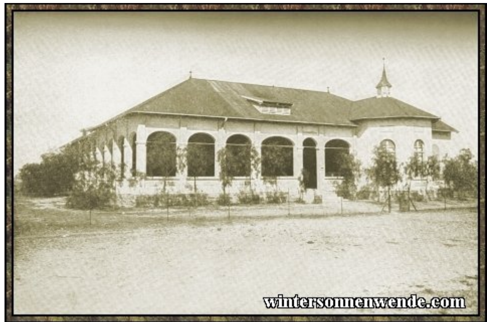
Entbindungsheim in Windhuk, Deutsch-Südwestafrika. [aus der engl. Ausgabe]

Gegen diese aus dem Kautschukhandel sich ergebenden Mißstände hat die deutsche Kolonialverwaltung entschieden Stellung genommen und Maßnahmen getroffen, welche die wirtschaftliche Existenz und das Familienleben der Eingeborenen auf sicherere Grundlage zu