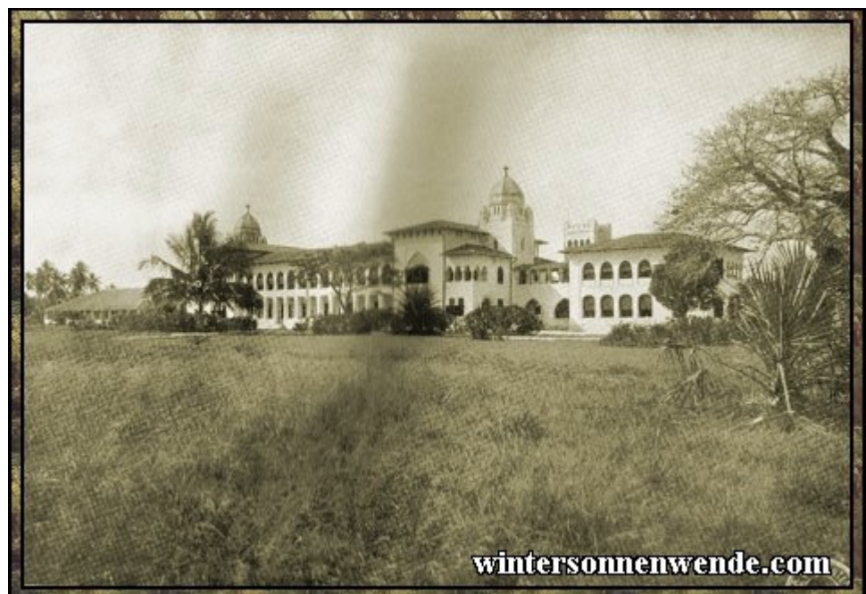
Gouvernements-Krankenhaus in Daressalam, Deutsch-Ostafrika.

Im übrigen liegt gar kein Anhalt dafür vor, daß unter der deutschen Verwaltung überhaupt