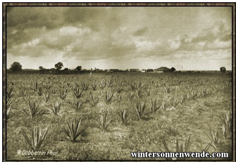
Junge Sisalpflanzung in Deutsch-Ostafrika.

Niemand hat in vornehmerer Weise den Leistungen der deutschen kolonialen Forscher, Entdecker, Pioniere und Leute der Wissenschaften seinen Tribut dargebracht, als es der hervorragende englische Kolonialsachverständige Sir Harry Johnstone in seinen Büchern über Afrika getan hat. Ich erwähne nur sein Opening up of Africa , erschienen 1911 (s. S. 238/41).