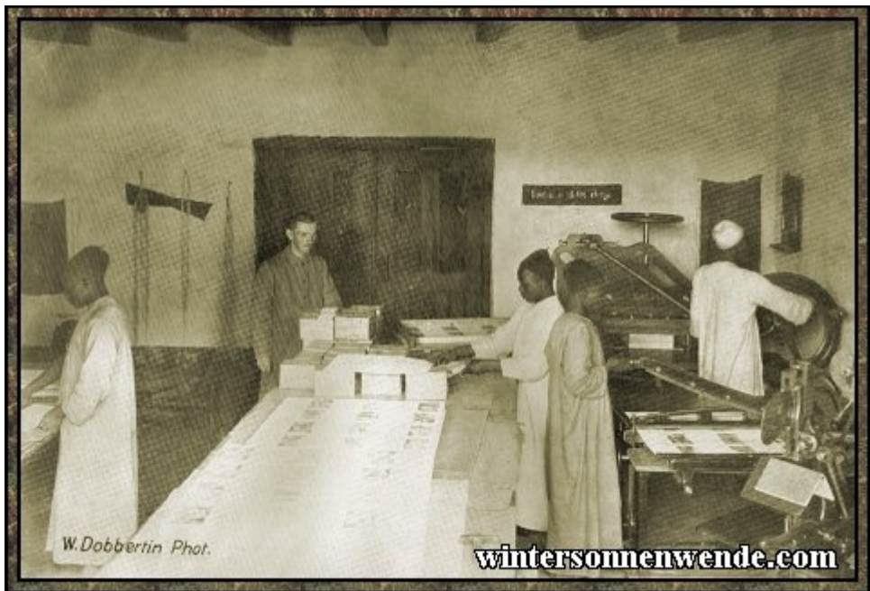
Der Schwarze als Gehilfe in einer Buchdruckerei, Deutsch-Ostafrika.