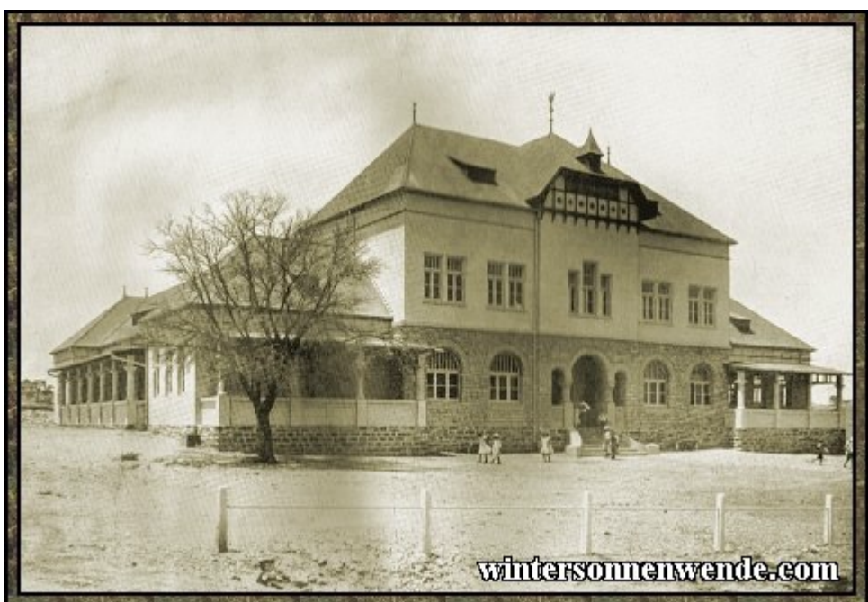
Volksschule in Windhuk, Deutsch-Südwestafrika.

Missionen in Togo, in dem nördlichen Teil von Kamerun, in Deutsch-Südwestafrika und in Deutsch-Ostafrika waren von Gott in offenkundiger Weise gesegnet. Sie leisteten einen einzigartigen Beitrag zu Afrikas Evangelisierung und