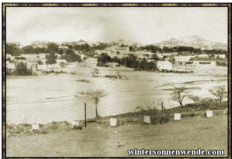
Ansicht von Windhuk, Deutsch-Südwestafrika.