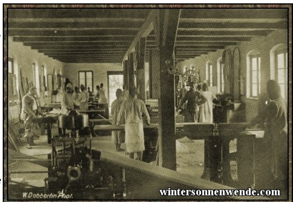
Der Schwarze als Tischler (Missionstischlerei in Deutsch-Ostafrika).