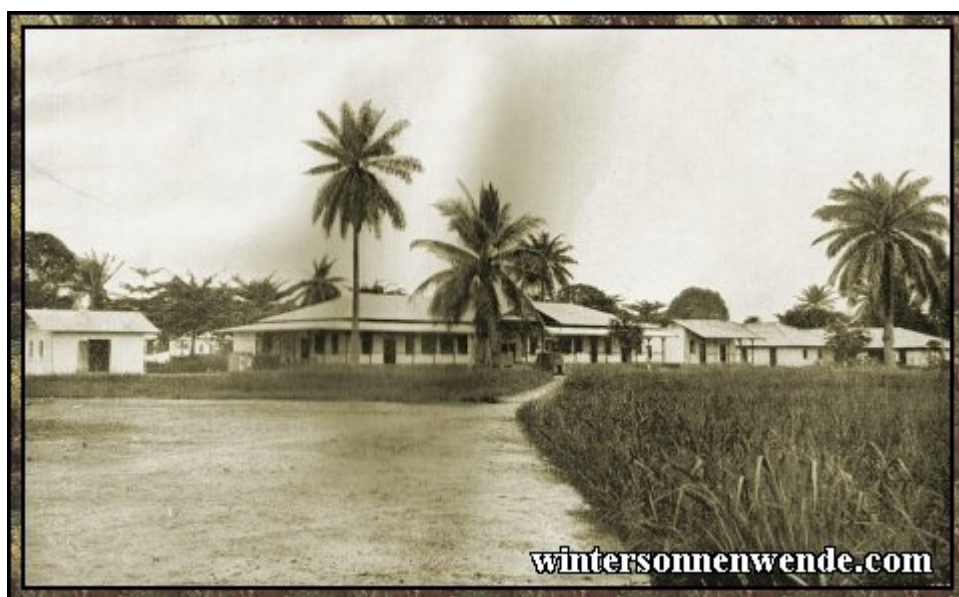
Eingeborenen-Krankenhaus, Duala, Kamerun.