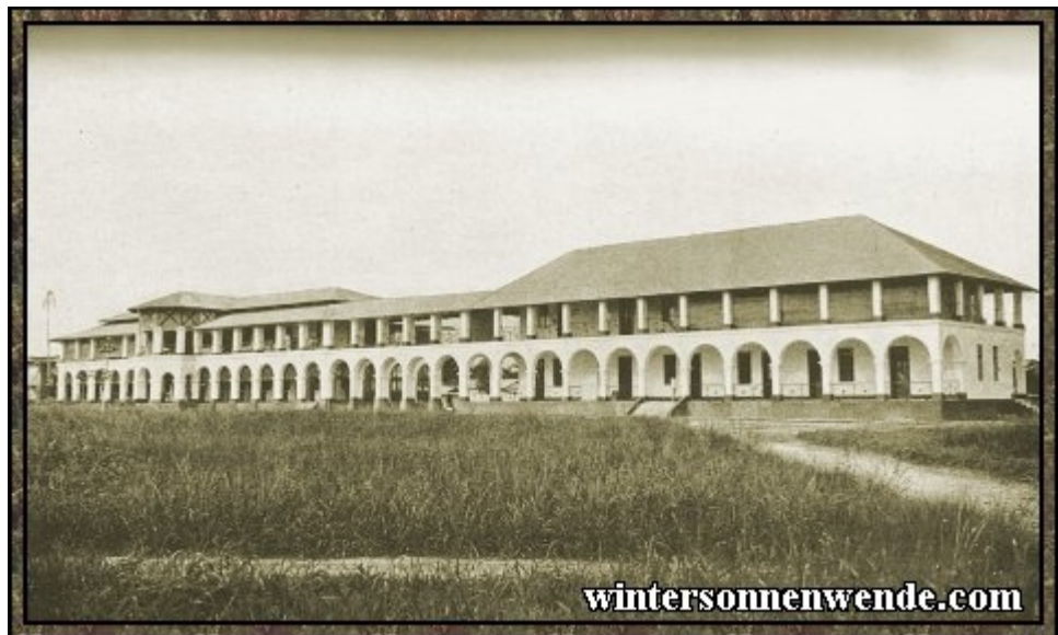
Gouvernements-Krankenhaus in Duala, Kamerun. [aus der engl. Ausgabe]

eine Verminderung der eingeborenen Bevölkerung in Deutsch-Ostafrika stattgefunden hat. Ich persönlich halte dies auf Grund meiner auf Reisen nahezu in allen Teilen der Kolonie gestützten Kenntnis der Eingeborenenbevölkerung für durchaus unwahrscheinlich. Die Schwarzen Ostafrikas sind in den meisten Gegenden eine kräftige, virile Rasse. Die