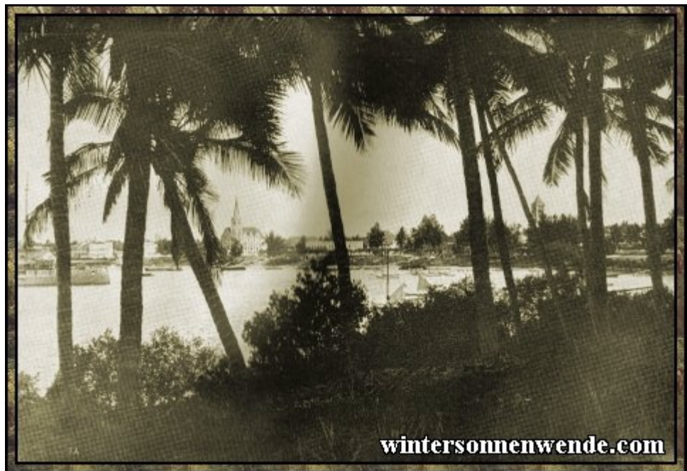
Ansicht von Daressalam, Deutsch-Ostafrika.

Vormals menschenleeres Steppengebiet wurde von europäischen Farmern mit stetig wachsenden Viehbeständen eingenommen. Wo einst in wochen- und monatelangen mühevollen Karawanenmärschen auf den Köpfen von Trägern wenige wertvolle Produkte aus dem Innern an die Küste geschafft wurden, wo der dichte