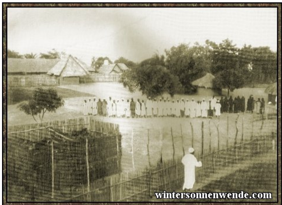
Schlafkrankenlager in Udjidji, Deutsch-Ostafrika.

Auch für Kamerun ist der Vorwurf der Entvölkerung durch Zwangsarbeit erhoben worden. Er ist gleichfalls unbegründet. Zwangsarbeit war in Kamerun, ebenso wie in den übrigen Kolonien, nur für öffentliche Arbeiten zugelassen. Im übrigen handelte es sich um freiwillige Arbeiten, zu denen die Eingeborenen durch private Anwerber angeworben wurden. In den Propagandaschriften wird die hohe Zahl von Todesfällen auf manchen Pflanzungen angeführt. Es ist richtig, daß die Sterbeziffer eingeborener Arbeiter zeitweise bedauerlich hoch gewesen ist. Das erklärt sich daraus, daß in den ungesunden Kameruner