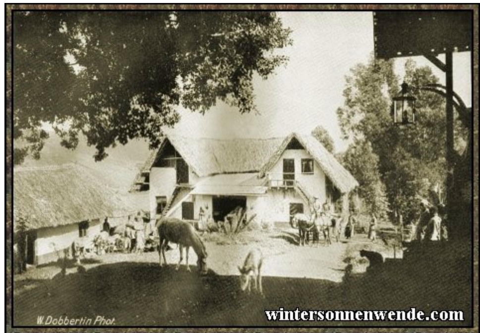
Farm in Wuga, Usambara, Deutsch-Ostafrika.

möchte auch erwähnen Dr. Albert Schweitzer, der im Zusammenhang mit der Bekämpfung des Aussatzes und der Schlafkrankheit hervorragende Leistungen in Zentralafrika vollbracht hat. Endlich möchte ich hervorheben jene Erfindung neuer wirksamer Heilmittel gegen die Dysenterie (Yatren 105) und gegen die Malaria (Plasmochin), welche