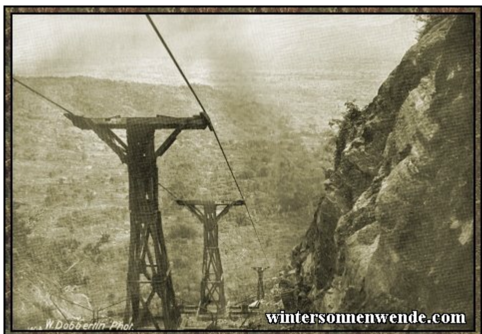
Drahtseilbahn in Usambara, Deutsch-Ostafrika.

"Wir haben versucht, es mit einer Regierung zu versehen, die nicht hinter der deutschen Verwaltung zurückstand... Ich fürchte, daß in einem oder zwei Jahren die Lage des Tanganyika Territorys ungünstig abschneiden wird bei einem Vergleich mit seinem