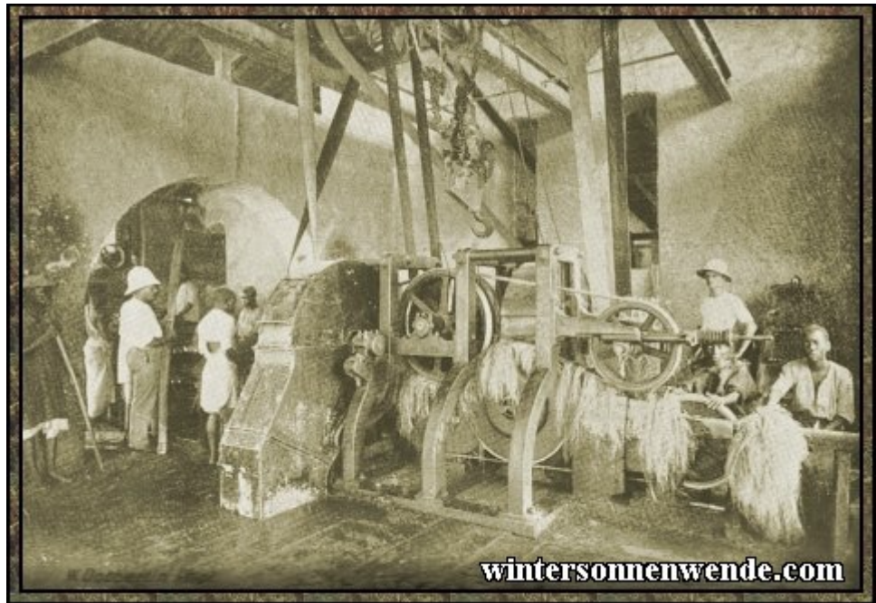
Sisalverarbeitung in Deutsch-Ostafrika. [aus der engl. Ausgabe]