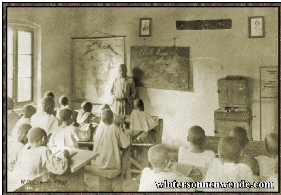
Schule in Wuga, Usambara, Deutsch-Ostafrika.

Zivilisierung. Ihre Missionare standen hinter niemandem an Selbstopferung und Eifer zurück. Was für geographische und Regierungsänderungen immer eintreten mögen, es wird nichts weniger als eine Kalamität für das Reich Gottes sein, wenn das christliche Volk Deutschlands keinen weiteren Teil an Afrikas Erlösung haben wird."