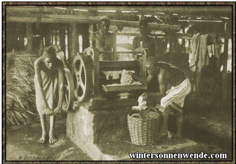
Kautschukwaschanlage in Deutsch-Ostafrika. [aus der engl. Ausgabe]

stellen geeignet waren, als es jene übrigens mit allmählicher Erschöpfung der wilden Kautschukbestände ohnehin abnehmende Kautschukausbeutung zu gewähren vermochte. Richtig ist, daß jene Kautschukausbeutung mit ihren Begleiterscheinungen des gewaltig angewachsenen Träger- und Karawanenwesens für einen Teil der Eingeborenenbevölkerung zeitweise eine starke Belastung mit sich brachte. Aber die Verwaltung hat doch alles getan, was in ihren Kräften stand, um diese Zustände zu mildern und den Eingeborenen eine andere Lebensgrundlage zu schaffen.