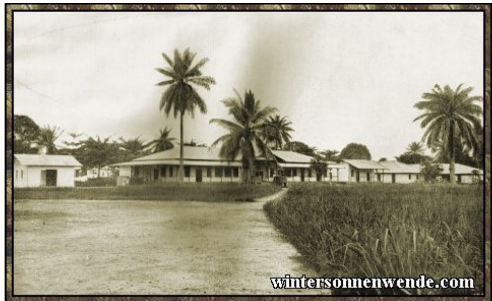
Eingeborenen-Krankenhaus, Duala, Kamerun.

Urwald ein Vordringen fast unmöglich machte, wo Dünen und Sand mit ihren Durststrecken kaum einen Ochsenwagenverkehr gestatteten, da stellten Eisenbahnen einen sicheren und schnellen Verkehr her und ermöglichten in stets wachsendem Maße die wirtschaftliche Erschließung des Innern und die Heranziehung der bis dahin ein abgeschlossenes Sonderleben führenden Völker des Binnenlandes zu dem kolonialen Kulturwerk.