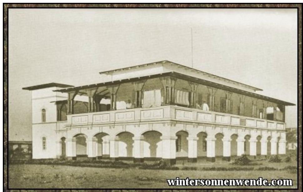
Königin-Charlotte-Krankenhaus in Lome, Togo. [aus der engl. Ausgabe]