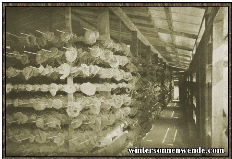
Kautschuktrockenanlage in Deutsch-Ostafrika. [aus der engl. Ausgabe]

Auch von der angeblichen Entvölkerung Kameruns gilt Ähnliches, wie von der Deutsch-Ostafrikas gesagt ist. Es haben Verschiebungen innerhalb der Eingeborenenbevölkerung stattgefunden. Eine allgemeine Abnahme der Bevölkerungszahl ist aber weder nachgewiesen noch wahrscheinlich. Ein sicheres Urteil darüber ermöglichen die bisher vorliegenden Zahlungen und Schätzungen nicht. Nach den Feststellungen des letzten Gouverneurs