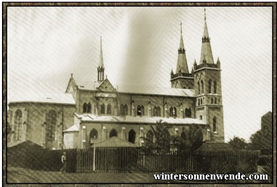
Katholische Kirche in Lome, Togo.

Farbige. Was die Verwendung von schwarzen Arbeitern im Dienste von Europäern betrifft, so war in allen Kolonien eine eingehende gesetzliche Regelung sowohl der Arbeiteranwerbung wie der Plantagenarbeit selbst erfolgt, deren leitender Gesichtspunkt der Schutz für Leib und Gesundheit der Arbeiter wie gegen ihre Ausbeutung durch die Unternehmer war.