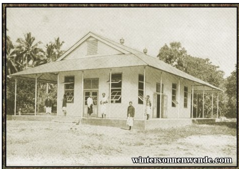
Schule in Malifa, Samoa. [aus der engl. Ausgabe]

Den Gefahren, welche die europäische Kultur in manchen Beziehungen für die primitiven Rassen mit sich bringt, war in den deutschen Kolonien durch eine Reihe von Maßnahmen wirksam vorgebeugt worden. Der Waffenhandel war allenthalben für die Eingeborenen untersagt und im übrigen einer scharfen amtlichen Kontrolle unterworfen. Die Abgabe von Alkohol an Eingeborene war in einigen Kolonien, wie in Deutsch-Ostafrika und in den Südsee-Kolonien, vollständig verboten, in den übrigen Kolonien waren im Anschluß an internationale Abmachungen durch Erhöhung der Einfuhrzölle und andere Maßnahmen Einrichtungen getroffen, um die Alkoholgefahr zu vermindern. Gegen Ausbeutung und Übervorteilung durch Europäer waren die Schwarzen dadurch geschützt, daß für den Abschluß von Verträgen zwischen Weißen und Eingeborenen die amtliche Genehmigung erforderlich und ohne diese der Vertrag ungültig war. Auf dem Gebiet des Landbesitzes insbesondere sorgte eine genaue Prüfung von amtlichen Landkommissionen oder sonstigen amtlichen Stellen dafür, daß bei Übertragung von Grundstücken an Weiße genügend Land nicht nur für die jetzt in der Gegend wohnenden Eingeborenen, sondern auch für ihre Nachkommen in ihrem Eigentum blieb. Die unparteiische Rechtsprechung der deutschen Beamten schützte den Eingeborenen gegen Unbill und Schädigung durch jedermann, Weiße sowohl wie auch