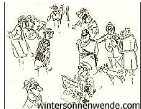
Faschingsaufakt: Diese Maske (DRP. angem.) garantiert dem Träger Schutz vor dem Gummiknüppel und sieht stark demokratisch aus