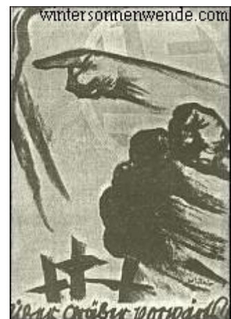
Über Gräber vorwärts Postkarte von Mjölmir

Vielfach wurde auch erklärt, moderne Propagandaarbeit widerspräche dem preußischen Militärgeist, dessen letzte Trägerin die nationalsozialistische SA. sei. Es hätte dem alten Preußen manchmal sehr zum Vorteil gereichen können, wenn es sich der Waffe der politischen