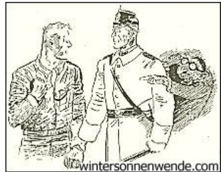
Bruder, wen verfolgst Du?

Das war nun wirklich ein Geniestreich des Alexanderplatzes. Es war damals das erste Mal, daß eine Massenverhaftung in diesem Stil durchgeführt wurde, und sie erregte denn auch in weiten Kreisen des In- und Auslandes größtes Aufsehen. Unter Bedeckung von Karabinern und geschwungenen Gummiknüppeln werden siebenhundert Menschen schuldlos massenverhaftet und der Polizei eingeliefert.