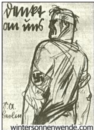
Denkt an uns! SA. Berlin! Postkarte von Mjölner

Manchmal und oft zog die Berliner SA. an einem klirrendkalten Wintersonntag aus Berlin heraus. Dann marschierte sie in fest aufgeschlossenen Kolonnen in Schnee und Regen und Kälte durch versteckte, einsam liegende märkische Flecken und Dörfer, um auch in der Umgebung von Berlin für die nationalsozialistische Bewegung zu werben und zu agitieren.