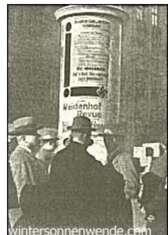
Plakat zur Versammlung am 4. Mai 1927

Ich merkte sofort, daß wir es hier offenbar mit einem Lockspitzel zu tun