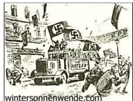
Her zu Hitler!

Wir haben vor den Widerständen nicht kapituliert. Wir haben die Widerstände gebrochen, und zwar immer mit den Mitteln, mit denen man sich uns entgegenstellte. Unerbittlich und hart wurde die Bewegung in diesem Kampf. Das Schicksal selbst hat sie mit schwerem Hammer eisern geschmiedet. In jungen Jahren schon war sie einer Verfolgung preisgegeben, unter der jede andere Partei in Deutschland zusammengebrochen wäre.