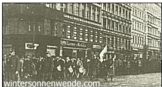
Die Hitler-Jugend marschiert

Anders beim Nationalsozialismus. Er hat von Anfang an nicht in den Parlamenten gefochten. Er bediente sich von früh auf moderner Propagandamittel: des Flugblattes, des Plakates, der Massenversammlung, der Straßendemonstration. Dabei mußte er sehr bald dem Marxismus begegnen. Zwangsläufig ergab sich die Notwendigkeit, ihn zum Kampf herauszufordern; und es blieb uns am Ende nichts anderes übrig, als uns derselben Mittel zu bedienen, die der Marxismus zur Anwendung brachte, wollten wir den Kampf erfolgreich zu Ende führen.