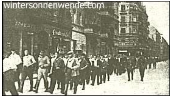
Die SA. marschiert!

Die Absichten, die der Marxismus bei dieser Taktik verfolgt, sind ohne weiteres klar. Er weiß, daß seine Macht in der Hauptsache auf der Beherrschung der Straße beruht. Solange er für sich allein das Mandat beanspruchen konnte, die Massen zu führen und unter dem Druck der Straße politische Entscheidungen nach seinem Belieben zu erzwingen, hatte er keinerlei Anlaß, mit blutigen Mittel gegen die bürgerlichen Parteien, die sich das ja schweigend gefallen ließen, vorzugehen. Als aber die nationalsozialistische Bewegung auftrat und für sich dasselbe Recht in Anspruch nahm, das der Marxismus als sein Reservat reklamierte, waren Sozialdemokratie und KPD. gezwungen, mit Terror dagegen anzukämpfen. Es fehlte ihnen einer logisch unterbauten nationalistischen Weltanschauung gegenüber an geistigen Argumenten, und so mußten dann Dolch, Revolver und Gummiknüppel am Ende diesen Mangel ersetzen.