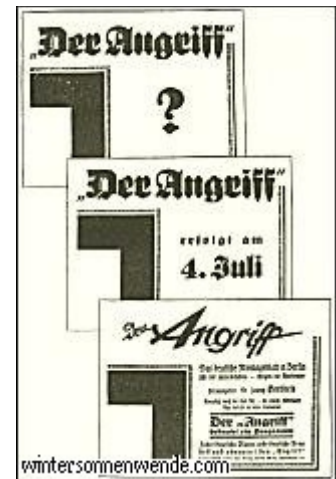
Wirksame Säulenreklame zum Erscheinen des "Angriff"

Damit war nun für die Öffentlichkeit das ruchlose Geheimnis, das sich hinter diesen mysteriösen Andeutungen verbarg, aufgedeckt. Es war offenbar, daß mit dem Angriff ein kommunistischer Putsch gemeint war. Dieser Putsch sollte am 4. Juli in Berlin beginnen, und, wie die Ankündigung der Roten Hilfe bewies, sorgte die kommunistische Partei bereits für sachgemäße Pflege und Betreuung der zu erwartenden Schwerverwundeten.