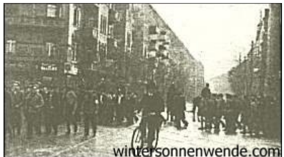
Eine gefährliche Ecke

Die öffentliche Meinung schweigt, wenn nationalsozialistische SA.-Männer auf den Straßen niedergeschossen werden. Man tut das mit ein paar Zeilen in irgendeiner verschwiegenen Zeitungsecke ab. Man läßt eine solche Mitteilung ohne jeden Kommentar. Man tut so, als müßte das so sein. Die marxistischen Gazetten bringen meistens überhaupt nichts davon. Sie verschweigen mit System alles, was ihre eigenen Organisationen belastet; und werden sie durch peinliche Umstände zum Reden gezwungen, so drehen sie den wahren Sachverhalt ins glatte Gegenteil um, machen den Angreifer zum Angegriffenen und den Angegriffenen zum Angreifer, schreien Zeter und Mordio, rufen nach der Staatsgewalt, machen die