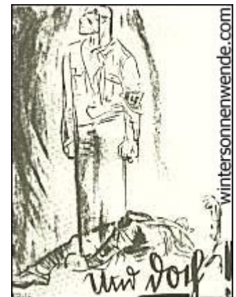
Und doch! Postkarte von Mjönir

Nicht wir haben das Blut, das vergossen wurde, gewollt. Für uns ist der Terror niemals weder Selbstzweck, noch Mittel zum Zweck gewesen. Schweren Herzens mußten wir uns mit Gewalt gegen Gewalt wenden, um den geistigen Vormarsch der Bewegung zu sichern. Keinesfalls aber waren wir bereit, widerspruchslos auf jene staatsbürgerlichen Rechte zu verzichten, die der Marxismus frech und anmaßend für sich allein reklamieren wollte.