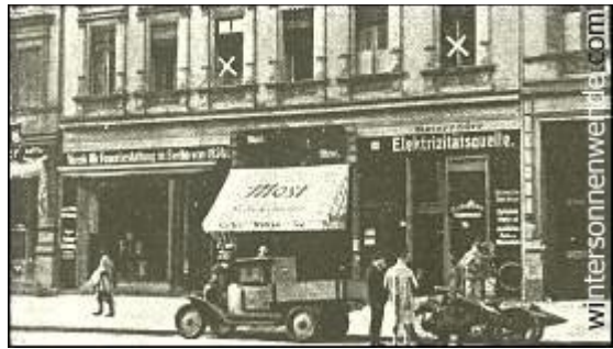
Lützowstraße 44 (XX): Zweite Geschäftsstelle der NSDAP. in Berlin

ein gewagter Sprung. Aus dem Kellerloch stiegen wir in die erste Etage. Aus dem verbrauchten Debattierlokal wurde eine feste, einheitlich organisierte politische Zentrale. Hier konnte die Bewegung umsichtig verwaltet werden. Die neue Geschäftsstelle bot vorläufig noch die Möglichkeit, weiteren Zugang in die Partei aufzunehmen und mit der Organisation zu verschmelzen. Das notwendigste Personal war engagiert, allerdings manchmal nach harten und bitteren Kämpfen mit den Parteigenossen selbst, die sich an den alten Trott und Schlendrian bereits so gewöhnt hatten, daß sie ihn für unentbehrlich hielten und meinten, jeder Vorstoß darüber hinaus sei ein Zeichen von kapitalistischer Prahlerei und Großmannssucht.