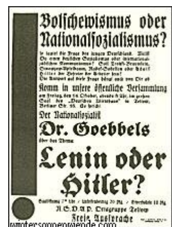
Propaganda rings um Berlin Text

Die kommunistische Partei glaubte damals den Augenblick gekommen, die letzten Reste der nationalsozialistischen Bewegung im blutigen Terror zu ersticken. Sie überfiel unsere Anhänger und Redner in den Versammlungssälen des Berliner Ostens und Nordens und versuchte, sie mit Gewalt zu Boden zu schlagen. Aber das war für alle SA.-Männer und Parteigenossen nur ein Grund mehr, bei der nächsten Versammlung