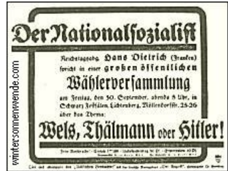
Versammlungsplakat während des Verbots

Unsere Erkenntnisse waren so natürlich und zwangsläufig, daß die Massen ihnen in steigendem Maße Sympathien entgegenbrachten. Solange wir den Ansturm des Volkes gegen die Tributpolitik in Händen hatten und damit auf das schärfste diszipliniert vortrugen, bestand wenigstens nicht die Gefahr, daß die Wellen der Empörung in nicht mehr zu bändigenden Formen über dem herrschenden Regime zusammenschlugen. Zweifellos war und ist die nationalsozialistische Agitation die Wortführerin der Volksnot. Aber solange man sie gewähren läßt, kann man die Volkswut kontrollieren und sich damit die Sicherheit verschaffen, daß sie sich in gesetzmäßigen und erträglichen Methoden äußert.