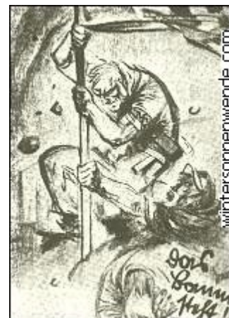
Das Banner steht! Postkarte von Mjölner

"Das Banner steht!" Diese hinreißende Parole auf einer der sechs Kampfkarten hatte nun ihre Berechtigung. Wir hatten die Fahne der nationalsozialistischen Idee gegen Terror und Verfolgung vorwärts getragen. Sie stand nun fest und unerschütterlich mitten unter uns, und niemals mehr - das war unser unabänderlicher Entschluß - sollte es gelingen, sie niederzulegen.