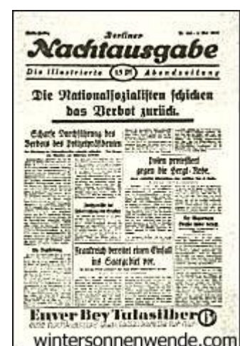
Die Berliner Presse zum Verbot der NSDAP. [Originalabbildung leider zu klein um genau zu entziffern, daher hier kein Link zum Text. Anm. d. Scriptorium]

Dort riß er barsch und frech die Türe auf, warf den Brief ins Zimmer hinein und schrie: "Wir Nationalsozialisten weigern uns, das Verbot anzuerkennen." Die Presse schloß daraus am anderen Tage nur noch mehr