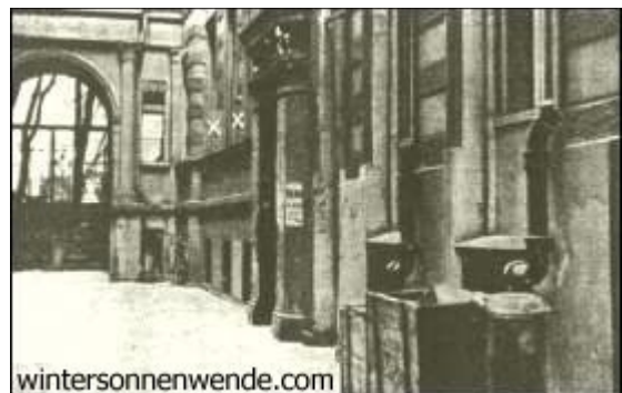
Die "Opiumhöhle" (XX) Erste Geschäftsstelle der NSDAP. in Berlin, Potsdamer Straße 109

Wir nannten diese Geschäftsstelle die "Opiumhöhle". Und diese Bezeichnung schien in der Tat absolut zutreffend zu sein. Sie war nur mit künstlichem Licht