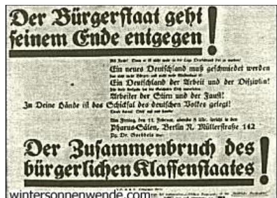
Plakat zu der Versammlungsschlacht in den Pharussälen Text

Das war eine offene Kampfansage. So von uns gemeint und so vom Gegner verstanden. Die Parteigenossen jubelten. Nun ging es aufs Ganze. Nun wurde das Schicksal der Berliner Bewegung kühn und verwegen in die Waagschale geworfen. Jetzt hieß es: gewinnen oder verlieren!