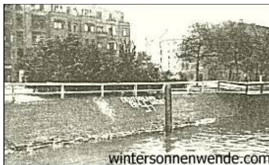
Ein stummer Appell [Am Flußufer: "Deutschland erwache!" Anm. d. Scriptorium]

Besäufnis war und sein Provokationsversuch in unserer Versammlung lediglich noch die Frage zuließ, ob es sich hier nur um einen Akt der Trunkenheit oder um eine bezahlte Lockspitzelei handelte. Aber was nutzte das, nachdem die Partei verboten und die Pressekampagne abgeebbt war. Die Journaille hatte ihr Ziel erreicht, die Kanonade auf die öffentliche Meinung hatte diese zur Kapitulation gezwungen, man hatte einen lästigen politischen Gegner mit den Mitteln der Staatsgewalt aus dem Weg geräumt und durch eine künstlich hergestellte Massenpsychose das öffentliche Gewissen beruhigt.