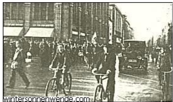
Marsch durch das rote Neukölln

Wie oft mußten wir es erleben, daß unsere SA.-Männer, die nur das primitivste Recht der Notwehr, das jedem Menschen zusteht, für sich in Anspruch genommen hatten, vor die Gerichte gestellt und als Landfriedensbrecher zu schweren Gefängnis- und Zuchthausstrafen verurteilt wurden. Man kann verstehen, daß unter diesen Umständen auf die Dauer die Empörung in der nationalen Opposition bis zur Siedehitze steigt. Man nimmt dem nationalen Deutschland die Waffen, mit denen es sich selbst gegen den Terror zur Wehr setzen könnte. Die Polizei versagt ihm den ihm staatsbürgerlich zustehenden Schutz für Leben und Gesundheit; und verteidigt der friedliebende Mensch schließlich in der letzten Verzweiflung sein Leben mit den blanken Fäusten, dann wird er obendrein noch vor den Richter geschleppt.