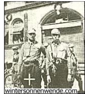
Gau-SA.-Führer Daluege (X) und sein Adjutant

Erst als der rote Mob heulend, grölend und fluchend das Feld geräumt hatte, konnte man feststellen, wie schwer und verlustreich diese Auseinandersetzung gewesen war. Auf der Bühne lagen zehn in ihrem Blut; meistens mit Stirn- und Kopfwunden und zwei mit schwerer Gehirnerschütterung. Der Tisch und die Treppe, die zur Bühne führte, waren mit großen Blutlachen bedeckt. Der ganze Saal glich einem einzigen Trümmerfeld.