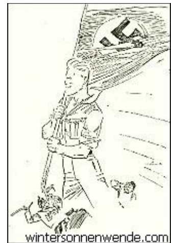
Uns kann keener!

Die Jugend erhob sich gegen die Vergreisung eines politischen Zustandes, die für sie unerträglich geworden war. Sie löste die Erstarrung des politischen Lebens und durchbrach die Dämme, die die aktive Beweglichkeit der deutschen Nachkriegspolitik einengten. Die Jugend hat die Geister aufgeweckt, die Herzen heiß gemacht und die Gewissen wachgerüttelt. Wenn es heute in Deutschland noch eine Hoffnung auf eine andere Zukunft gibt, wem anders wollte man das verdanken als uns und unserer Bewegung!