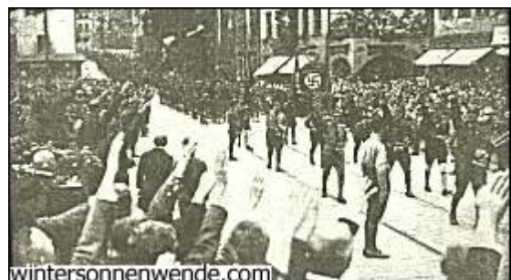
Die sturmerprobte Berliner SA. im Vorbeimarsch in Nürnberg (August 1927).

Die kampferprobte Berliner SA. hält die Spitze. Sie wird von Jubel und Blumen überschüttet. Es schlägt ihr hier zum erstenmal das Herz des deutschen Volkes entgegen.