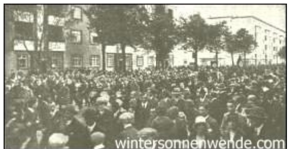
Marsch durch Spandau

Der Marxismus empfindet es schon als freche Anmaßung, wenn eine nicht marxistische Partei überhaupt an die Massen appelliert, überhaupt Volksversammlungen veranstaltet, überhaupt auf die Straße geht. Die Masse, das Volk, die Straße, das sind, wie der Marxismus glauben machen möchte, unbestrittene Vorrechte der Sozialdemokratie und des Kommunismus. Man überläßt den anderen Parteien Parlament und Wirtschaftsverbände. Das Volk aber soll dem Marxismus gehören.