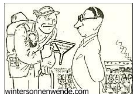
Wem Gott ein Amt gibt - - -

Der Angriff führte seinen Gegenhieb auf seine Art. Er brachte in der nächsten Nummer eine Karikatur, darauf der Berliner Polizeipräsident Dr. Bernhard Weiß in einer unnachahmlich grotesken Situation zu sehen war. Er stand da, eine große schwarze Hornbrille auf dem breiten Nasenrücken, die Hände nach hinten verschränkt, erstaunt einen SA.-Mann ansehend, der, die braune, blumengeschmückte Mütze im Nacken, mit breit grinsendem Lachen ihm gegenübertritt und einen Nürnberger Trichter entgegenhält. Die Überschrift lautete: "Wem Gott ein Amt gibt ..." Und darunter stand zu lesen: "Wir haben dem lieben Bernhard aus Nürnberg was Schönes mitgebracht."