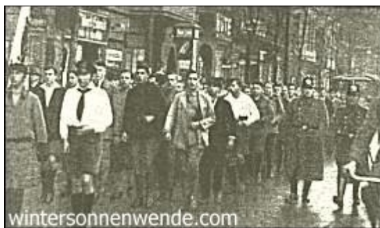
Hitler-Jugend marschiert durch den roten Südosten

Nationalsozialismus mit allen Mitteln niederhalten, und man ist letzten Endes ja auch dazu gezwungen; denn wenn der Nationalsozialismus Berlin erobert, dann ist es um die marxistische Vorherrschaft in ganz Deutschland getan.