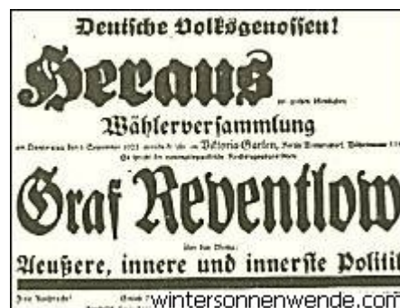
Plakat zu einer getarnten Versammlung

Vielleicht sah man es auch nicht ungerne, daß die Dinge sich so entwickelten. Man hatte keine ausreichenden Gründe, das Verbot der Partei weiterhin vor der Öffentlichkeit zu rechtfertigen. Man suchte also, sich ein Alibi zu verschaffen. Die Öffentlichkeit sollte mit Fingern auf uns weisen. Es sollte sich die Meinung festsetzen, daß diese Partei wirklich nur eine Zusammenrottung von verbrecherischen Elementen sei und die Behörden nur ihre Pflicht täten, wenn sie ihr jede weitere Lebensmöglichkeit unterbanden.