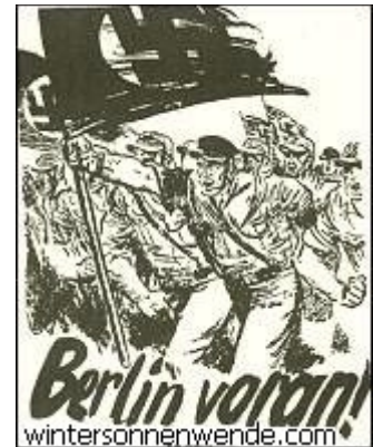
Berlin voran! Postkarte von Mjöltnir

Dieser junge Künstler hat das seltene Talent, nicht nur die bildnerische Darstellung, sondern auch die schlagkräftige Wortformulierung mit genialer Virtuosität zu meistern. Bei ihm entstehen Bild und Parole in derselben einmaligen Intuition, und beide zusammen ergeben dann eine mitreißende und aufrührerische Massenwirkung, der sich auf die Dauer weder Freund noch Feind entziehen können.