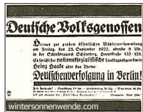
Plakat zu einer blutigen Versammlung in Schöneberg