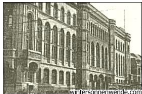
Der Berliner Alex

Um so übler aber wurde das am Alexanderplatz vermerkt; und da man nur sehr wenig gegen uns ausrichten konnte, weil wir die Lacher auf unserer Seite hatten, zog man sich, anstatt sich sachlich zu verteidigen, in die Sicherheit des Amtes zurück und suchte mit behördlichen Maßnahmen das zu ersetzen, was dort an geistigen Mitteln offenbar zu fehlen schien.