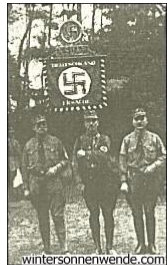
SA. Spandau (Standartenträger)

Das war das erstemal, daß das Pflaster der Reichshauptstadt vom Marschtritt der SA.-Bataillone erklang; die SA. war sich der Größe dieses Augenblicks vollauf bewußt. Quer durch Lichterfelde, Steglitz, Wilmersdorf erreicht der Zug das Zentrum des Westens und mündet zur Hauptverkehrsstunde mitten in die Judenmetropole, auf den Wittenbergplatz, ein.