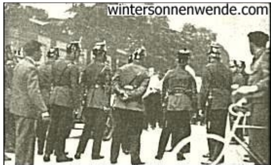
Im Interesse der Ruhe und Ordnung

Diese Hoffnung hat uns betrogen; und wenn heute in weiten Kreisen der nationalsozialistischen Bewegung eine grenzenlose Verachtung bürgerlicher Gesinnungsfeigheit um sich gegriffen hat, so ist das nicht die Folge parteipolitische Hetze, sondern eine gesunde und natürliche Reaktion auf jenen Mangel an Zivilcourage, den das Bürgertum unserer Bewegung gegenüber immer und immer wieder gezeigt hat. Uns sind die Gründe nicht unbekannt, die der Bildungsphilister zur Rechtfertigung dieser infamen Haltung immer wieder ins Feld führt. Man sagt, der Kampf, wie wir ihn führen, sei wenig vornehm und entspreche nicht den in erzogenen Kreisen üblichen Umgangsformen. Man hält uns für ordinär, wenn wir die Sprache des Volkes sprechen, die allerdings ein arroganter Spießier weder zu reden noch zu verstehen vermag. Der Bürger will den Frieden um des Friedens willen, auch wenn er der Leidtragende eines faulen Friedens ist. Wie der Marxismus die Straße eroberte, zog er sich feige in seine vier Pfähle zurück, und verschüchtert und ängstlich saß er hinter den Gardinen, als die SPD. die bürgerliche Weltanschauung aus der Öffentlichkeit vertrieb und in massivem Angriff das monarchische Staatsgefüge zum Sturz brachte. Die bürgerliche öffentliche Meinung steht mit der jüdischen Journaille in einer einheitlichen Front gegen den Nationalsozialismus. Sie gräbt sich damit ihr eigenes Grab und begeht aus Angst vor dem Tode Selbstmord.