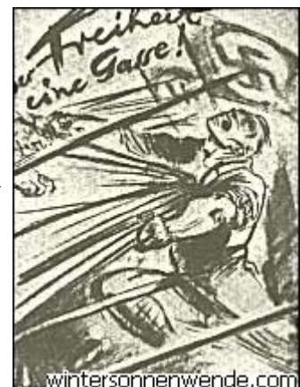
Der Freiheit eine Gasse! Postkarte von Mjölhir

Man darf es uns nicht verdenken, daß wir diesen heldenhaften Kampf