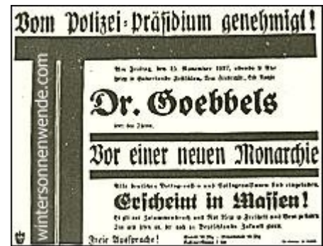
Vom Polizeipräsidium genehmigt!

Alle waren sie herbeigeeilt, die Vorkämpfer der nationalsozialistischen Bewegung in Berlin. SA.- und SS.-Männer, politische Funktionäre, die Anhängerschaft von nah und fern. Die alte Parteigarde fand sich zusammen, um die Wiederauferstehung der nationalsozialistischen Bewegung feierlich zu begehen. Zwar war das Verbot des Polizeipräsidioms noch nicht gefallen; noch nahezu ein halbes Jahr mußten wir darauf warten, daß aus Unrecht wieder Recht wurde. Aber es war unwirksam geworden. Schikanen und Zwangsmaßnahmen hatten sich sichtbar als erfolglos erwiesen. Die Bewegung hatte mit zäher Beharrlichkeit die Fesseln gesprengt, in die man sie schlagen wollte.