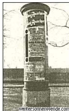
Plakat zur zweiten großen Spandauer Versammlung gegen die KPD.

Mit sechs Autos fuhren wir von Berlin die Heerstraße herauf, da uns zu Ohren gekommen war, daß einzelne Trupps des RFB. schon die Anfahrt verhindern wollten. In einem verschwiegene Restaurant, mitten im Wald hinter Spandau, hatten wir unser Hauptquartier aufgeschlagen, und von da aus pürschten wir uns an die Stadt heran. Die geplante Sprengung der Versammlung konnte nicht durchgeführt werden. Die KPD. brachte es nur noch nach der Versammlung zu einem blutigen Feuergefecht an der Putlitzstraße. Wir hatten zwar wieder eine Reihe von Schwerverletzten, aber der Sieg war unser!