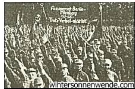
Fußmarsch Berlin - Nürnberg