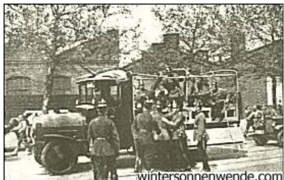
Verhaftung eines nationalsozialistischen "Schwerverbrechers"

Viele SA.-Leute sind damals in die Gefängnisse gewandert, weil sie in dem Verdacht standen, zu späten Abendstunden am Kurfürstendamm ein Exemplar statuiert zu haben. Die Gerichte gingen dagegen mit drakonischen Strafen vor. Eine Ohrfeige kostete in den meisten Fällen sechs bis acht Monate. Aber damit konnte das Übel nicht ausgerottet werden. Solange die Partei verboten war und man ihren Führern die Möglichkeit nahm, beruhigend auf die Massen einzuwirken, blieben solche Exzesse unvermeidlich. Das Polizeipräsidium ging nun dagegen mit einer neuen