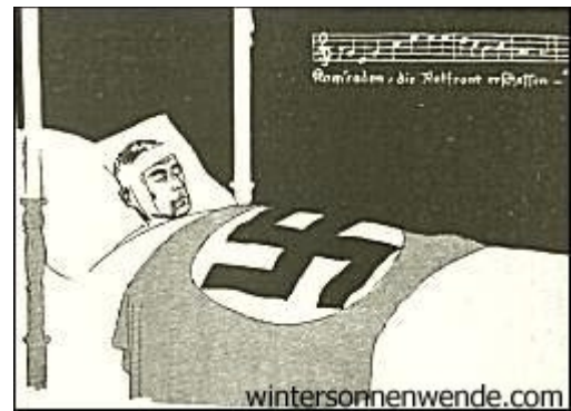
Horst Wessel Ein Toter ruft zur Tat!

Der Ton liegt hier auf politisch. Der SA.-Mann war und ist ein politischer Soldat. Er dient der Politik. Er ist weder Söldner noch Bravo. Er selbst glaubt daran, was er verteidigt und wofür er sich