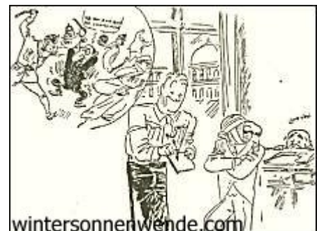
(Text in Gedankenblase: "Ich bin doch beim Polizeipräsidium!" Figur hinter Schreibtisch: "Zörgiebel")

Dagegen mußten wir Stellung nehmen. Das war ein Gebot der Selbstachtung. Die nationalsozialistische Bewegung hätte sich moralisch aufgegeben, wenn sie das widerspruchslos hingenommen hätte; und da es uns damals noch an einem publizistischen Organ in Berlin fehlte, beriefen wir für den 4. Mai eine Massenversammlung im Kriegervereinshaus ein. Sie war als Protestversammlung gegen die damals von der Darmstädter Bank, insbesondere deren Geschäftsinhaber Jakob Goldschmidt, inszenierten Börsenmanöver gedacht. Wir hatten