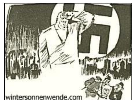
Berlin erwacht langsam!

Am 29. Oktober 1927 mußte es auch dem Schwarzseher und Skeptiker klar werden, daß eine neue Phase in der Entwicklung der nationalsozialistischen Bewegung in Berlin eingesetzt hatte. Jener SA.-Mann, der da mit umflorter Fahne stark und trotzig vor eine ergriffene Gemeinde hintrat und in hinreißenden und aufrüttelnden Versen seinem Zorn und Ingrimme Luft machte, hatte das ausgesprochen, was in dieser großen Stunde das heiß schlagende Herz der alten Parteigarde bis zum Überlaufen ausfüllte: