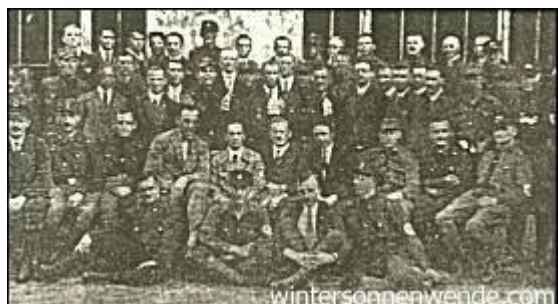
Die Berliner Führerschaft (1927)

Die Bewegung hatte hier nur einen Lehrmeister: den