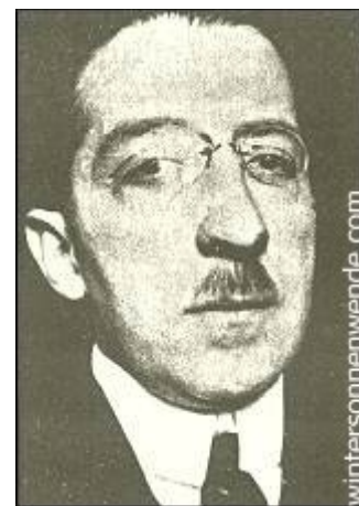
Herr Dr. Bernhard Weiß Polizeipräsident von Berlin

Das kam aber im Ernst gar nicht in Frage. Unsere Parteigenossen waren von politischen Gegnern angegriffen worden und hatten sich zur Wehr gesetzt. Sie hatten damit das primitivste Recht, das jedem Staatsbürger zusteht, das Recht der Notwehr, auch für sich in Anspruch genommen. Niemals waren unsere Leute die Angreifer, sondern immer nur die Angegriffenen gewesen. Nirgends konnte auf unserer Seite von Exzessen die Rede sein. Wir hatten uns der Brachialgewalt nur insoweit bedient, als wir damit unser Leben und unsere Gesundheit verteidigten.