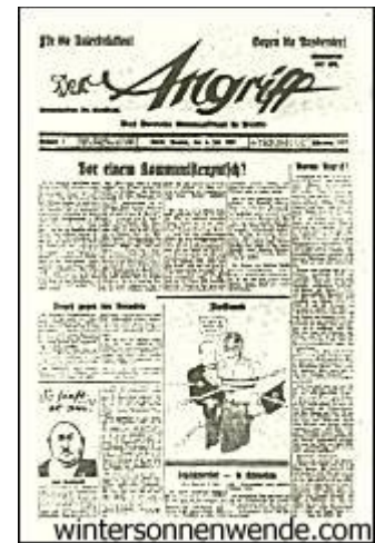
Die erste Nummer des "Angriff" [Originalabbildung leider zu klein um genau zu entziffern, daher hier kein Link zum Text. Anm. d. Scriptorium]

Das machten wir uns zunutze. Wo man es uns verwehrte, mit der Feder anzugreifen, da bedienten wir uns des zeichnenden Stiftes. Prototypen der Demokratie, die dem Wort gegenüber von einer mimosenhaften Empfindlichkeit waren, wurden nun einem geneigten Publikum mit Karikaturen